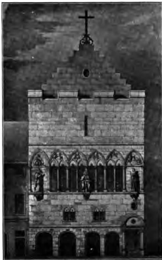
La Maison du Miroir.

encore son emplacement le Coin du miroir. Il n'y a plus trace de la Chapelle-aux-Riches, ni de la vaste nef des Cordeliers où de nombreuses familles avaient leurs sépultures, ni du couvent des Dominicains, démoli en 1874 pour faire place aux Halles. La Madeleine n'a conservé que le cadre de sa porte d'entrée, décoré à l'antique dans le style du XVI e siècle.